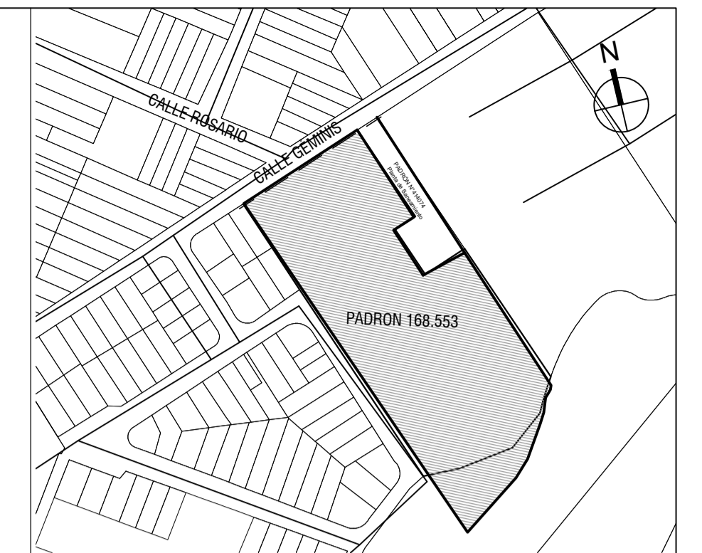
PLANO DE UBICACIÓN escala 1/4000